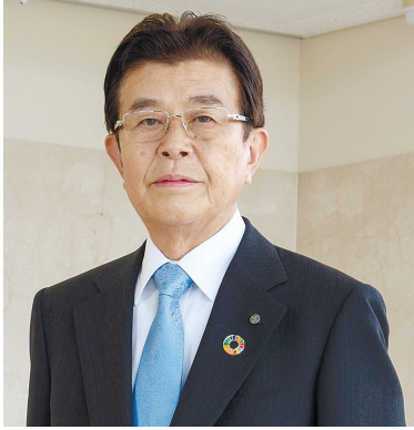
公益財団法人 神澤医学研究振興財団