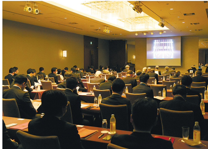
4年ぶりに開催された講演会(2023年6月2日、ハレスホテル東京)

同財団は、1997(平成9)年6月の設立以来、周産期および高・老年期の女性に発現する各種疾患に関する成因、予防、診断、治療等の多角的な研究を奨励するための助成事業および優れた研究成果に対する褒賞事業を行い、その研究成果を発表の場として講演会を開催しています。新型コロナウイルス感染症拡大の影響により、2020~2022年の講演会は実施を見合わせ、今年は4年ぶりの開催となりました。