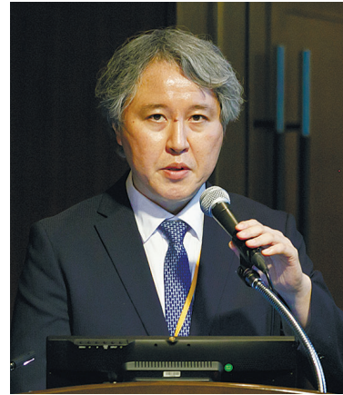
東京大学大学院 医学系研究科 産婦人科学講座