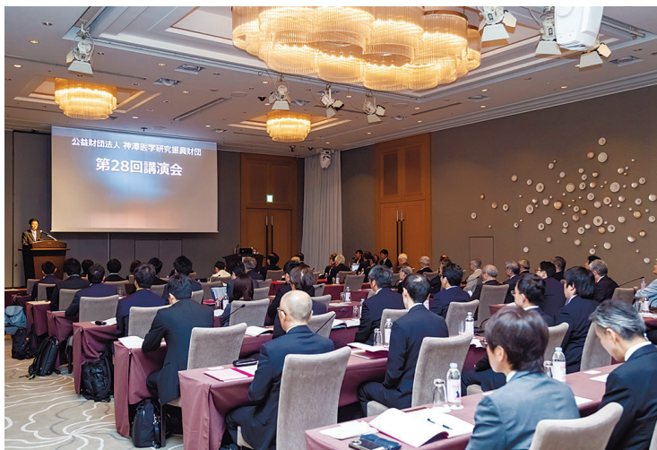
6月5日にパレスホテル東京で開催された「第28回講演会」

同財団は1997(平成9)年6月の設立以来、周産期および高・老年期の女性に発現する各種疾患に関する成因、予防、診断、治療等の多角的な研究を奨励するための助成事業および優れた研究成果に対する褒賞事業(神澤医学賞)を行い、その研究成果を発表する場として毎年、講演会を開催しています。